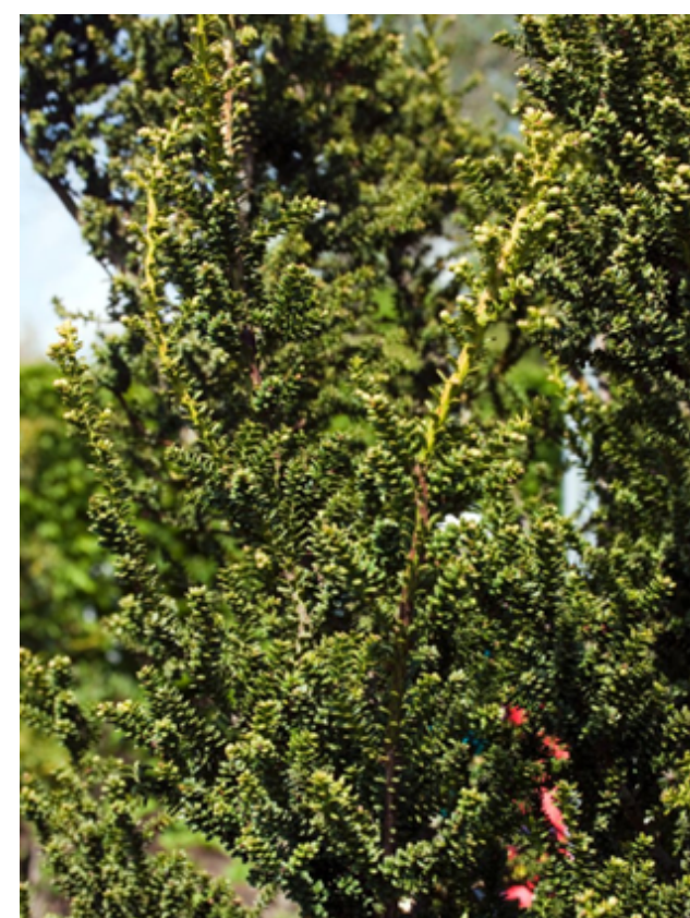
Taxus cuspidata 'Amersfoort' Eibe 'Amersfoort'