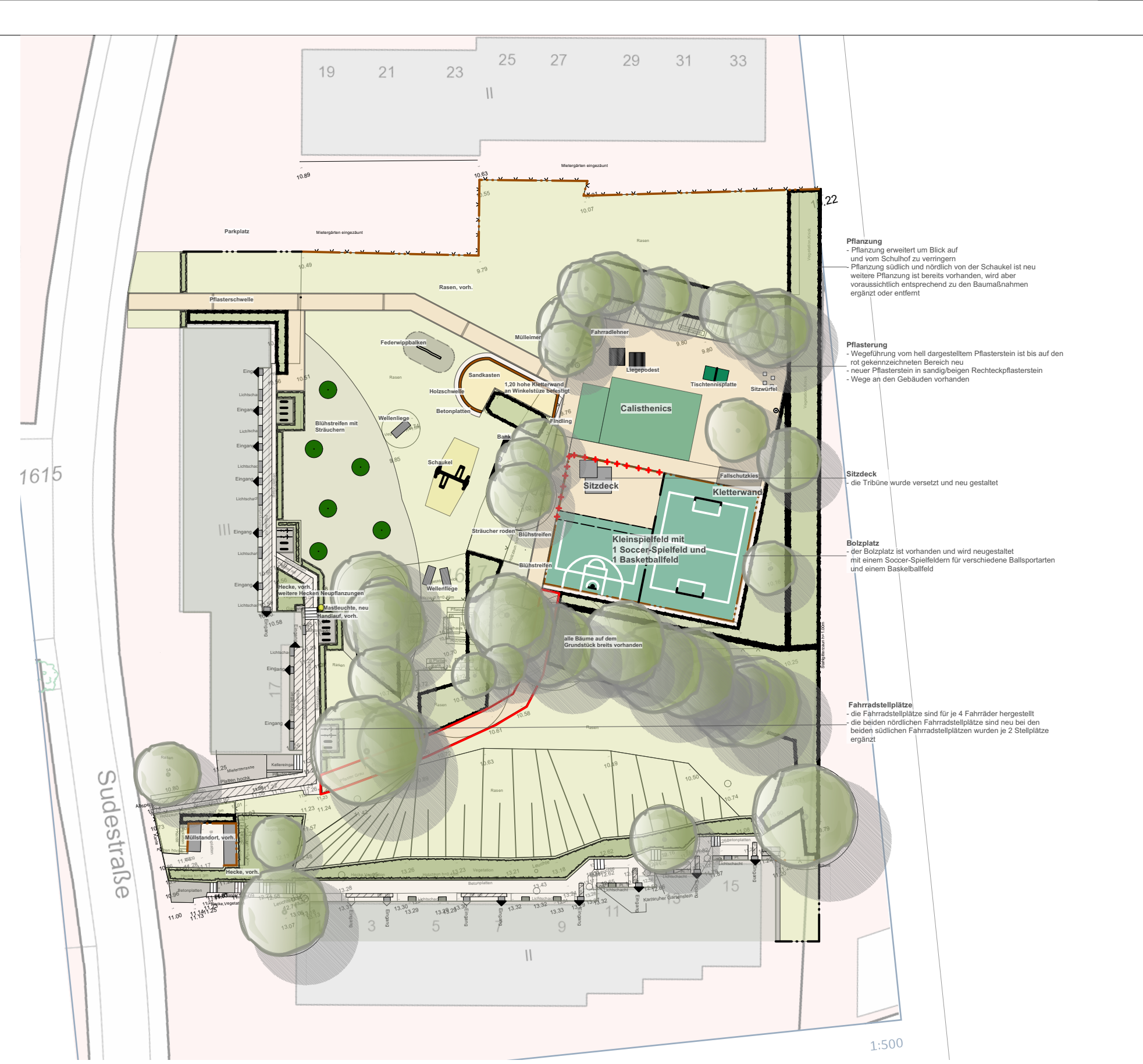
Entwurf Sudestraße M1:500