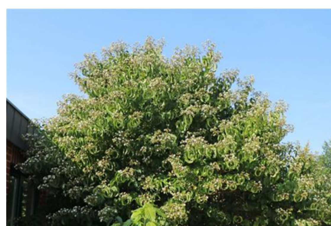
Heptacodium miconioides Sieben-Söhne-des-Himmels-Strauch