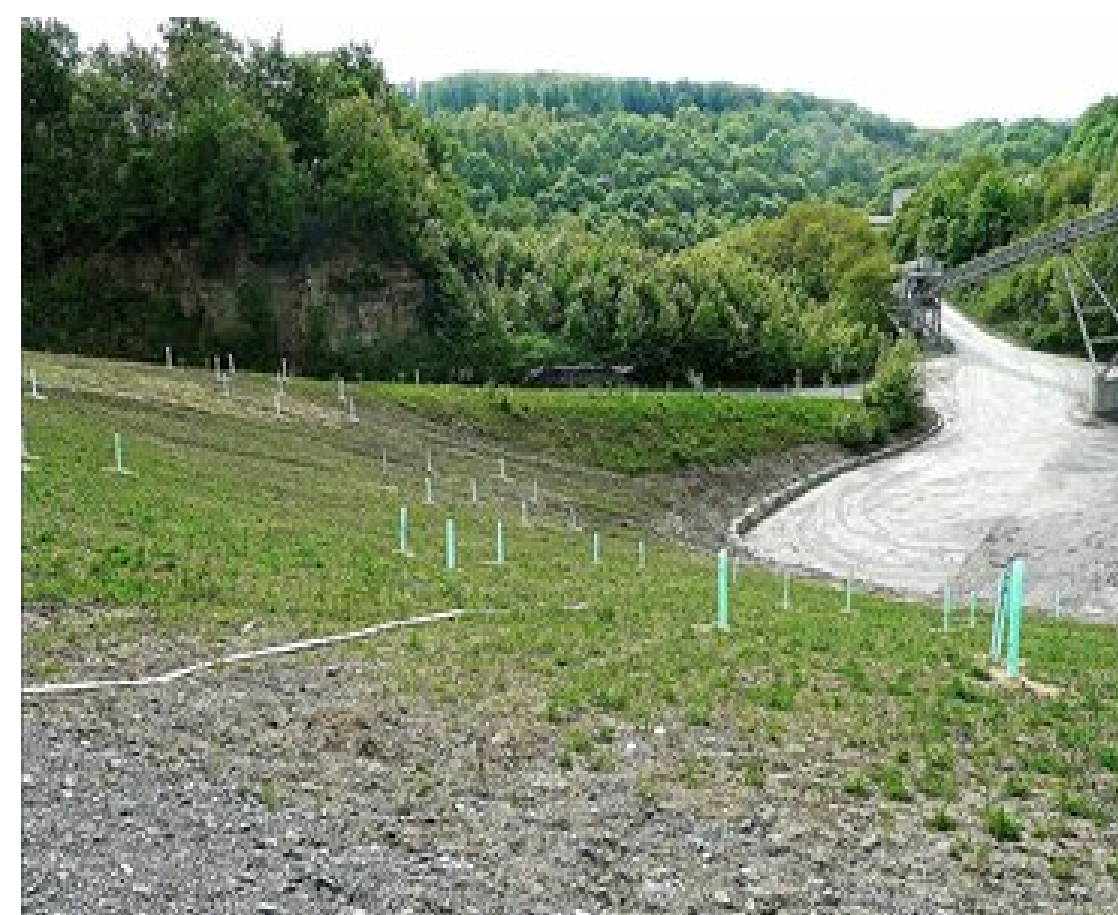
Untersaat für Gehölze