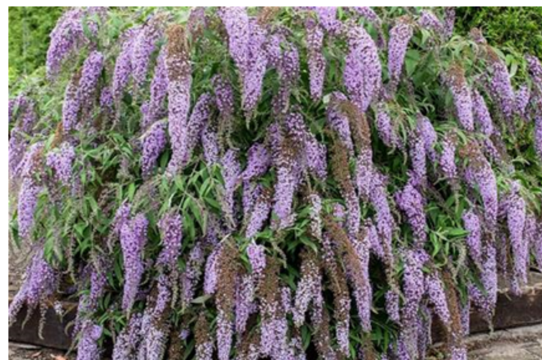
Buddleja davidii 'Wisteria Lane' Sommerlieder / Schmetterlingsstrauch 'Wisteria Lane'