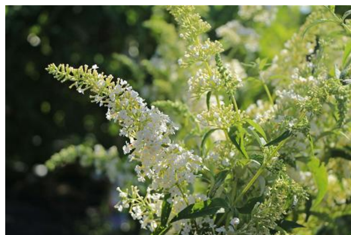
Buddleja davidii 'Dart's Ornamental White' Sommerlieder / Schmetterlingsstrauch 'Dart's Ornamental White'