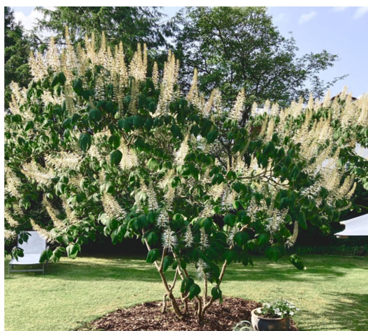
Aesculus parviflora Strauchkastanie