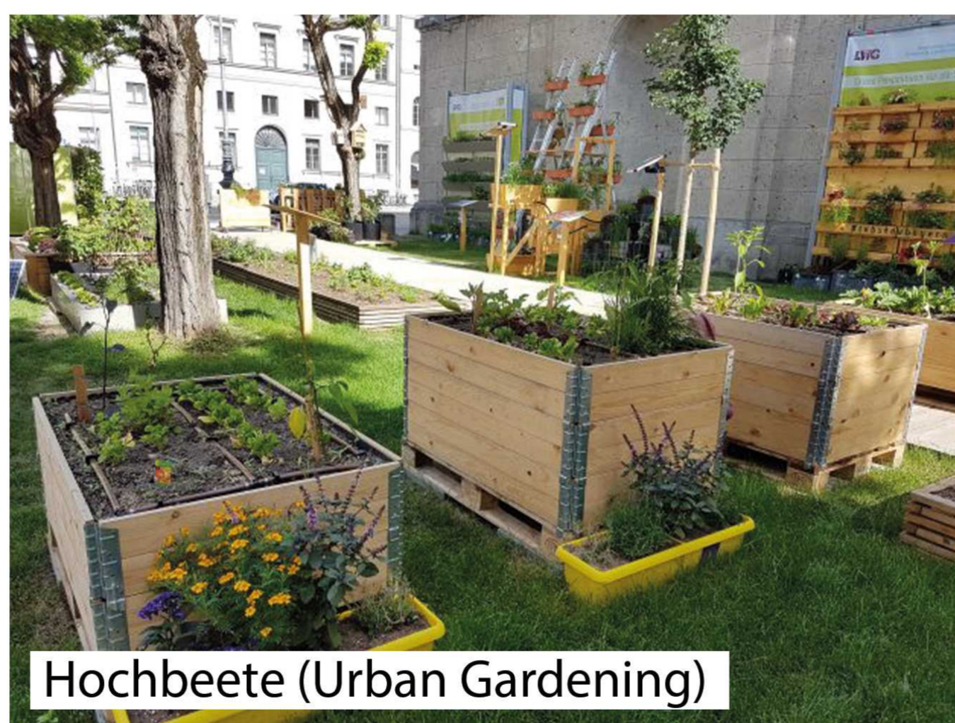
Hochbeete (Urban Gardening)