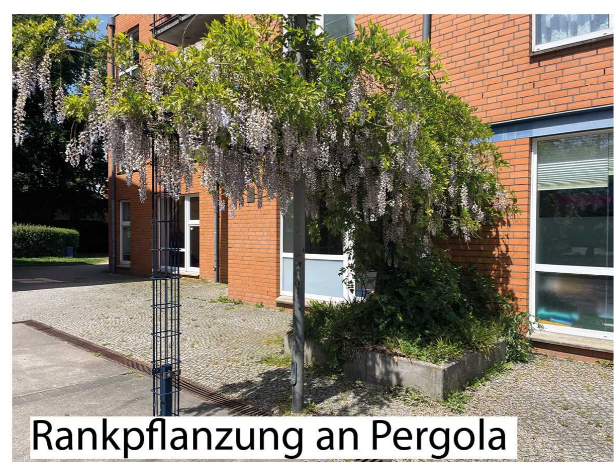
Rankpflanzung an Pergola